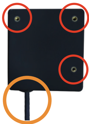
由機身下方出線 & 機身背面螺絲固定孔(M2.5)