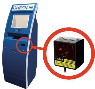
尺寸小，易整合於Kiosk中